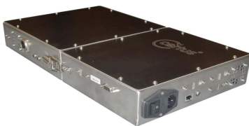
Le contrôleur mural

Système électromagnétique technologie Barkhausen jusqu'à 2 UP.